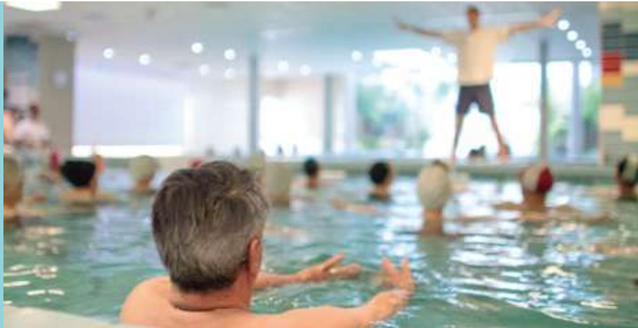
Mobilisation en piscine