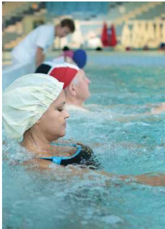
Douche sous-marine Forte pression